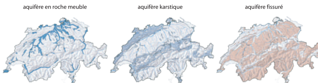
Figure 4: Répartition de différents aquifères en Suisse. 16

Ces changements dans la reconstitution des eaux souterraines ont pour effet que le débit des sources proches de la surface et alimentées par un bassin versant de faible étendue, de même que celui des aquifères karstiques, subiront des variations saisonnières plus fortes et pourront en partie tarir en été et en automne. Dans les gisements d'eau souterraine situés dans des alluvions de vallée sous le régime d'écoulement du Plateau, il faut s'attendre à une baisse du niveau des eaux souterraines en été et en automne. Les niveaux des nappes pluvéatiques dans les alluvions de vallée sous régime d'écoulement alpin, qui présentent leur maximum saisonnier en été, n'enregistreront qu'une faible baisse. Néanmoins, il faut compter, dans ce cas aussi, avec des niveaux plus bas pendant les étés caniculaires, qui seront plus fréquents, et pendant l'arrière-saison d'été et l'automne, en raison du ralentissement de la fonte des glaces. On s'attend également à une légère baisse des niveaux des aquifères profonds.