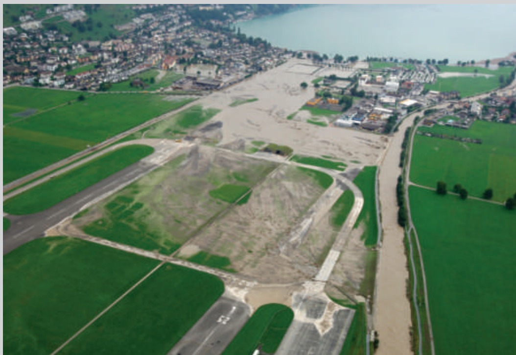
Figure 3: En août 2005, la crue de l'Engelberger Aa a été déviée de manière à éviter la zone construite, sensible en termes de dommages.

Afin de limiter les dégâts à un niveau supportable en cas de crue d'ampleur exceptionnelle, les masses d'eau excédentaires sont déviées vers des aires moins sensibles en termes de dommages. Cette mesure d'urgence a été appliquée lors de la crue d'août 2005. Entre 25 et 50% du débit de crue a été dévié vers des places de sport, des aires agricoles, des parkings et d'autres zones peu sensibles situées en marge de l'agglomération. Ce type de mesure doit être préparé au niveau des constructions et de l'aménagement du territoire.